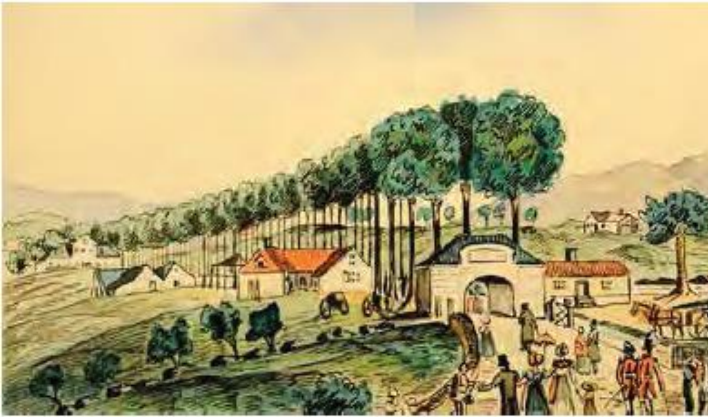
Nygårdsalléen i Bergen. Prospekt av J.F.L.Dreier