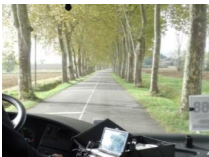
Sud de Gardouch - RD 16 potentiel d'itinéraire touristique (O5.)