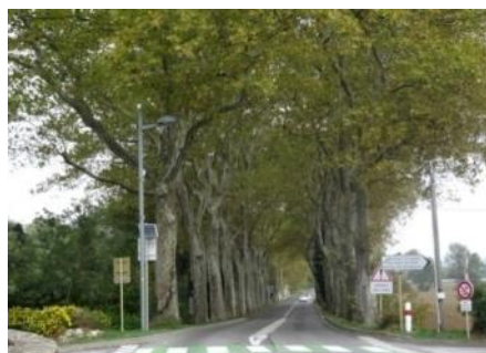
Gardouch RD 622 : arbre engageant le gabarit - Panneau « arbres inclinés » (O2.)