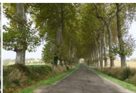
Seyre RD 91D - Platanes de 1830-1870 en crête de talus. Bande enherbée côté champs (O2. O5.)