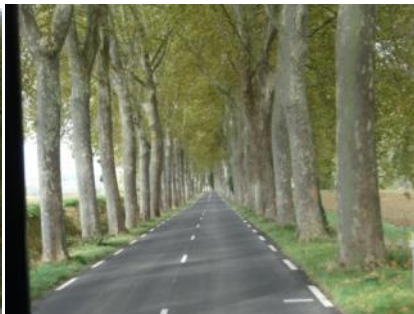
Nord-ouest de Gardouch RD 16 (O5.)