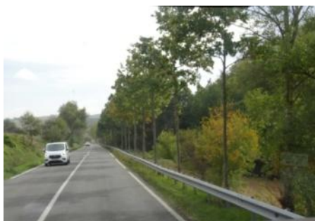
Seyre RD 622 - Nouvelle plantation derrière glissière (O2.)