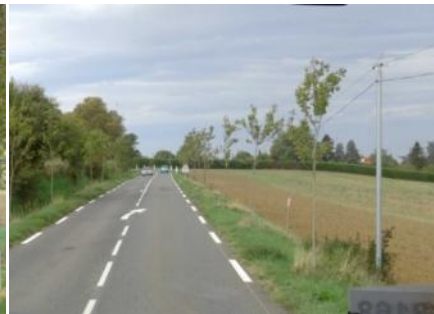
Montesquieu-Lauragais RD 16 - Nouvelle plantation sur accotement sans glissières (O2.)